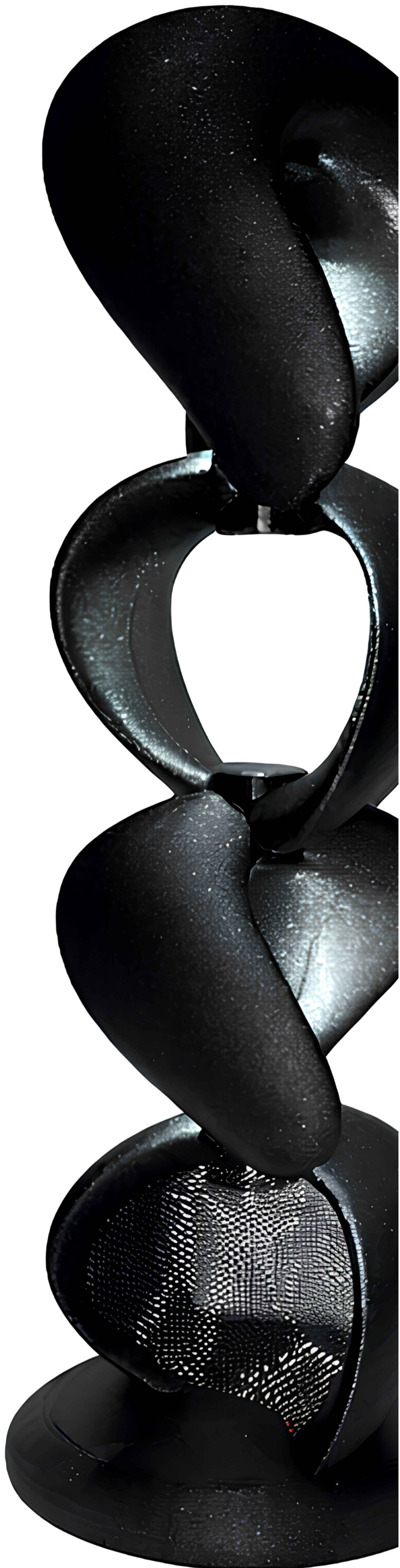
3D-Modell | Laura Karneil