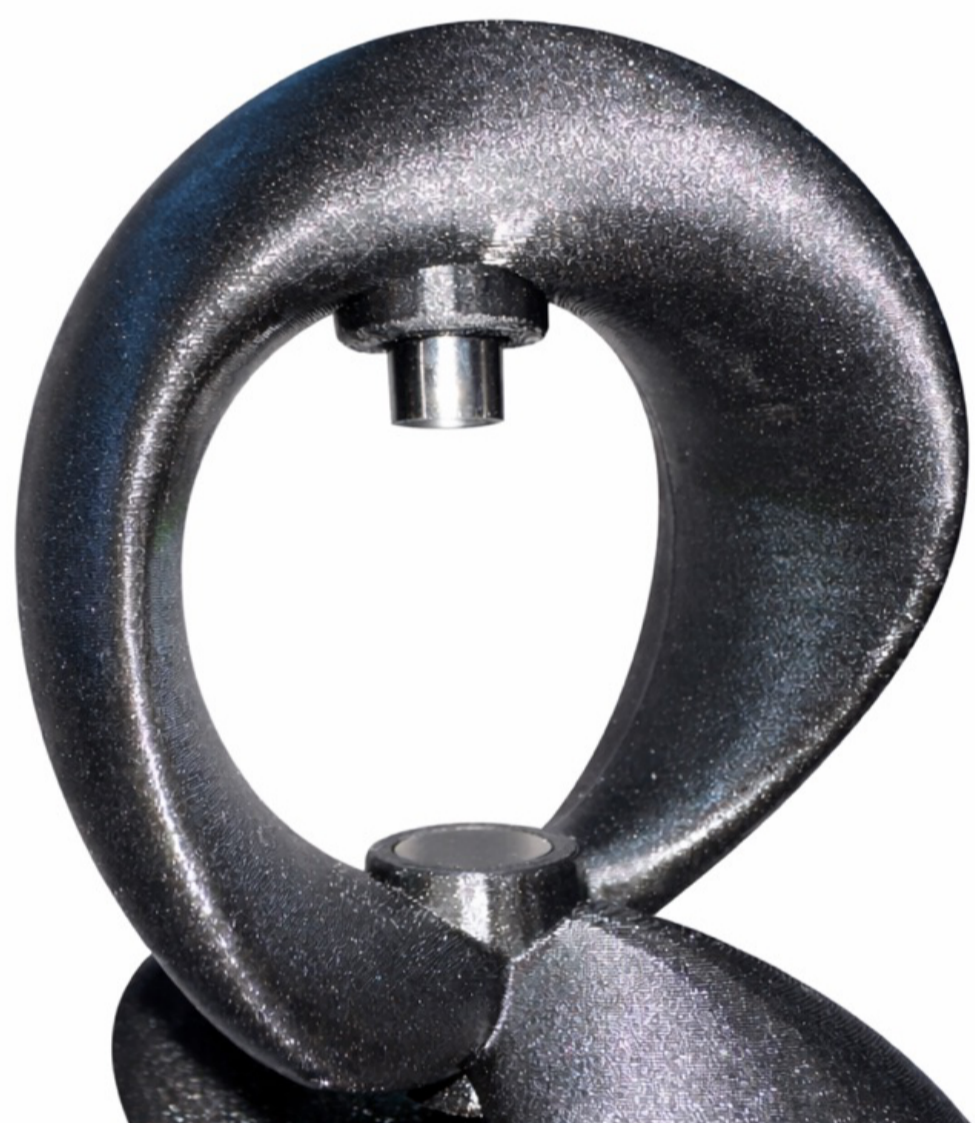
Gitternetz im unteren Segment | Laura Karneil

Im unteren Bereich der Station befindet sich ein Gitterelement, das den Einzug und die Filtration des kosmischen Staubs übernimmt. Mit einer Höhe von 1,75 m sind die Zapfstellen so angeordnet, dass Menschen unterschiedlicher Körpergrößen komfortabel und barrierearm Zugang zu Trinkwasser erhalten.