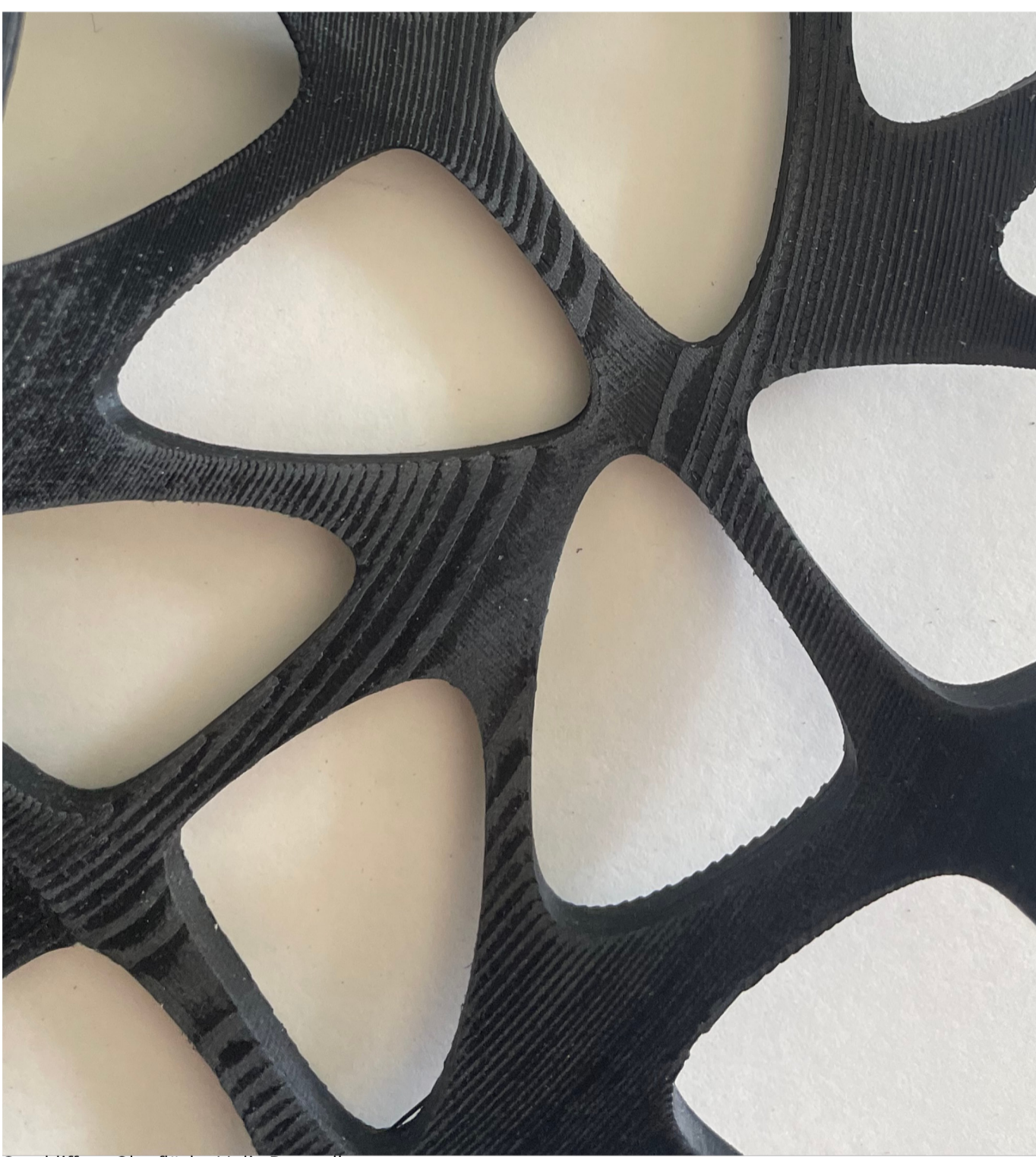
Geschliffene Oberfläche | Julia Pruszydlo

Die fließende Form der Glasflasche bildet die Grundlage für das digitale Design. Die Form wurde aufgenommen und weitergeführt, sodass ein geschwungener Korb um die Flasche herum organisch herum wächst. Die perforierte Hülle umschließt sie und lässt die glänzende Oberfläche des Glases durchscheinen. Das Muster basiert auf Kleeblatt-Formen , die für Leichtigkeit und eine Dynamik sorgen sollen. Die Nachbearbeitung der Oberfläche bringt einen weiteren gestalterischen Aspekt vor. Durch das abschleifen der Filament-Bahnen, welche typischerweise nach dem 3D-Druck sichtbar sind, entsteht eine Optik, die der Maserung von Holz gleicht und das eigentliche Material PLA in den Hintergrund rücken lässt.